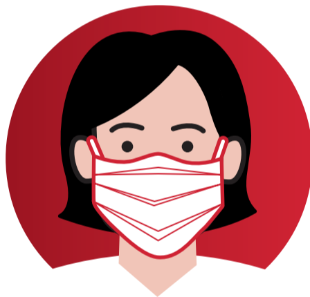
Schutzbekleidung für Mitarbeiter und Helfer