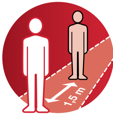
Abstand von min. 1,5 m einhalten