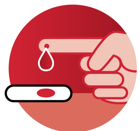
Hb-Messung nur von der Fingerkuppe